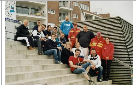
Die Veranstalter, Hanse SV und DLRG Rostock