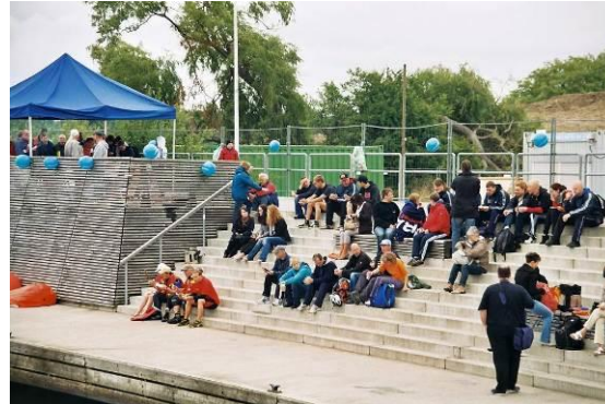
Der neue Veranstaltungsort und der Zuschauerbereich:

Die Hafenterrassen an der Westseite der Holzhalbinsel / Innenstadt Rostock