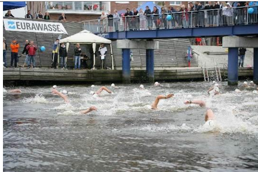
Eurawasser- Warnowschwimmen 2012, Start