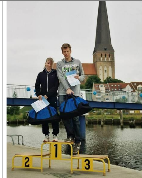
Eurawasser- Warnowschwimmen 2012, Sieger in der Gesamwertung

Die Hafenterrassen an der Westseite der Holzhalbinsel / Innenstadt Rostock