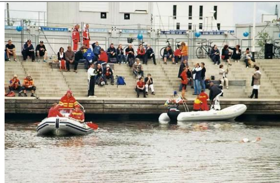
Eurawasser - Warnowschwimmen 2012, Zuschauer und Streckenabsicherung